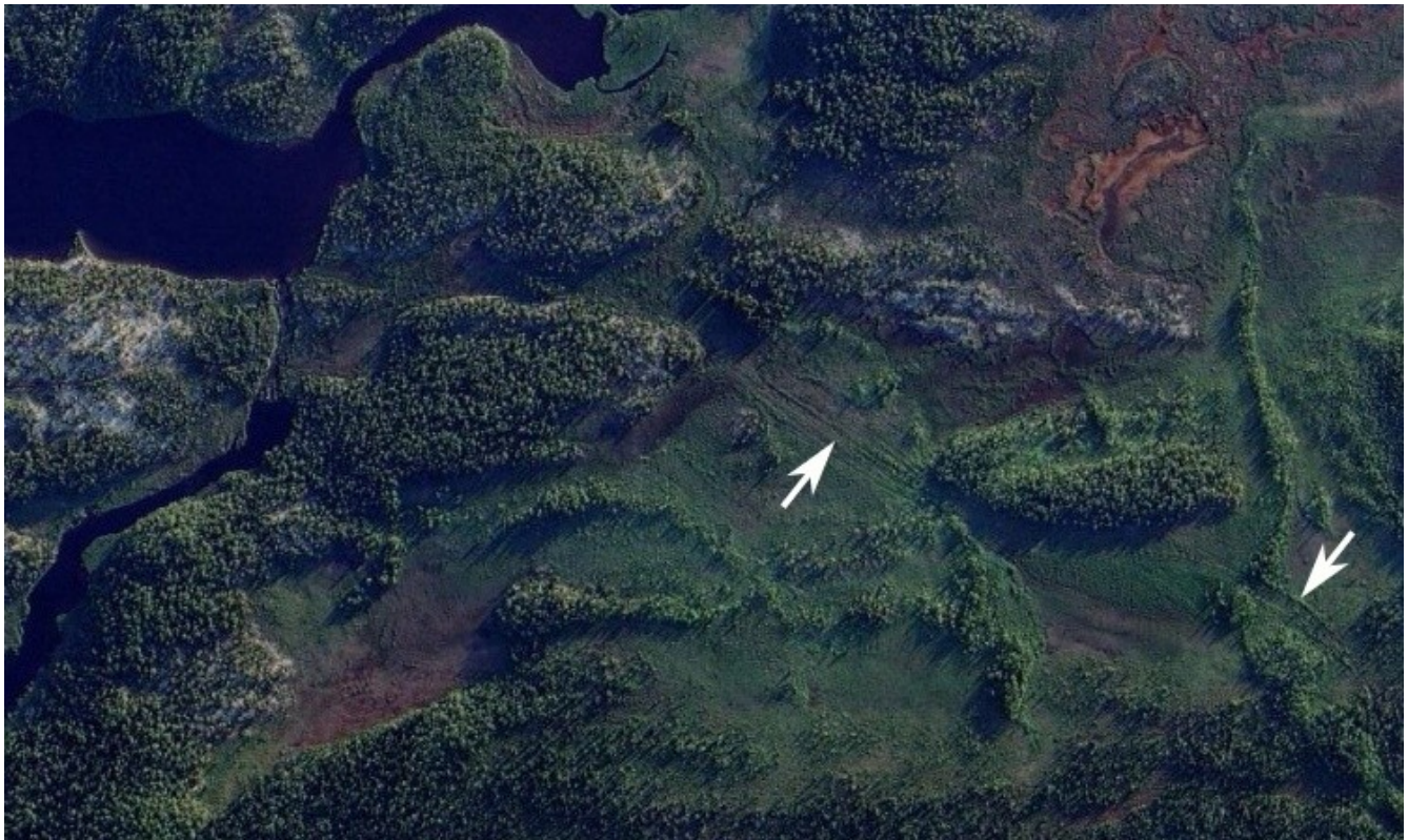
Вот так выглядит вездеходный след в тундре на спутниковом снимке (стрелки).

Есть! Еле различимый, но вполне пригодный для движения след! И как будто чтобы развеять все сомнения, сбоку вынырнула аккуратная цепочка отпечатков лисьих лап и повела меня дальше вниз, в большом уже елкам, по которым я, оказываюсь, успел соскучиться за дни, проведенные в тундре.