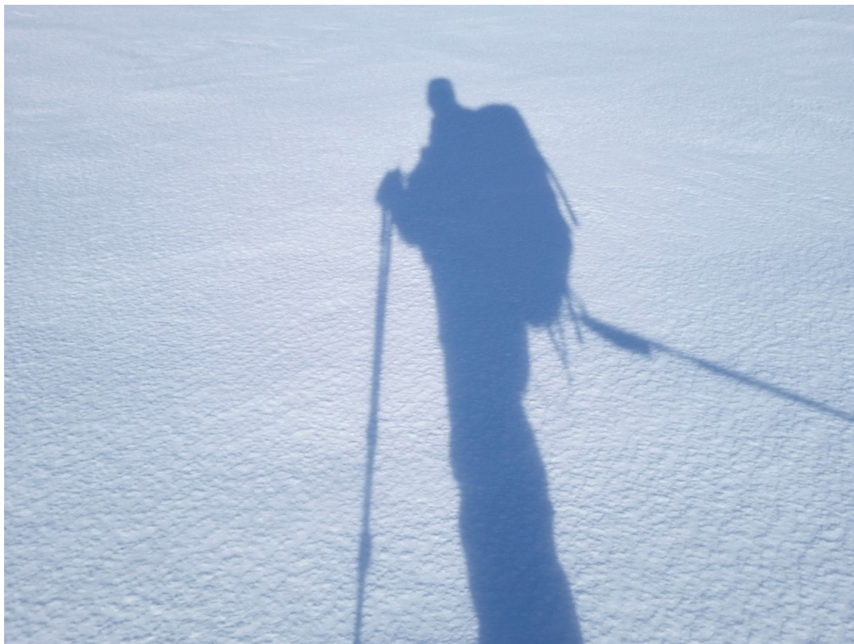
Автопортрет в тундрах.

А день-то становится хорош! Впервые вижу свою тень.