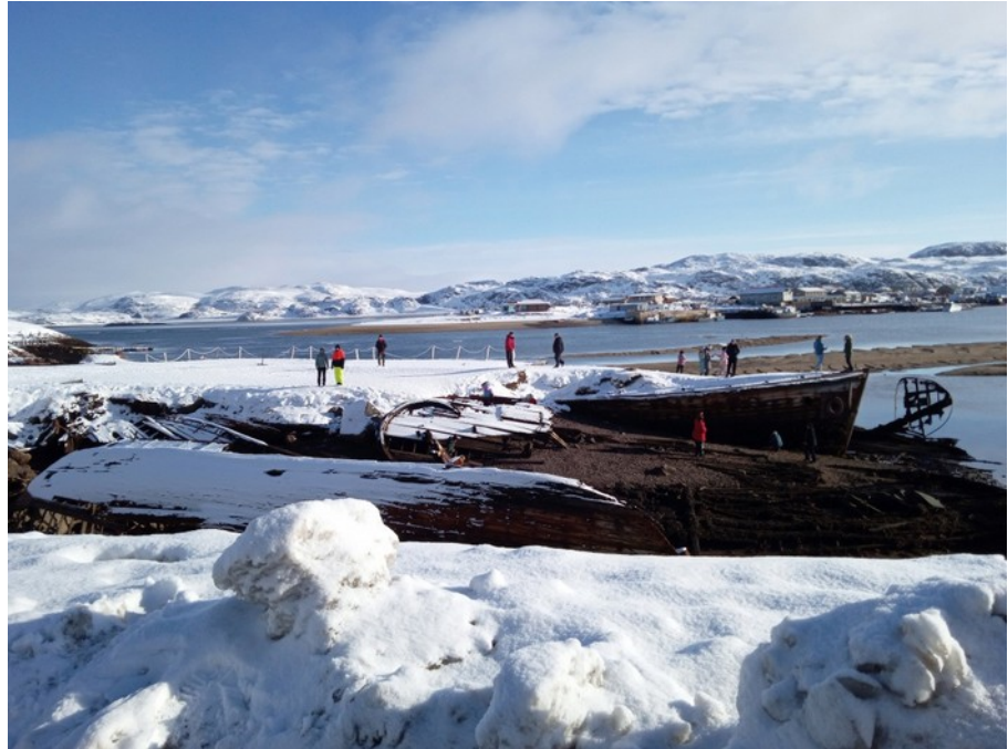
Териберка, кладбище кораблей.

Окрестности Териберки не особо похожи на тундру, скорее - на миниатюрные горы. Скальные стенки, хаос долинков в разных направлениях, миниатюрные перевалы, озера в котловинах. В голове ритмом марша всплывает "Ты снова здесь, ты собран весь.." Я теперь знаю, в первой долине от озера заманчивым путем налево - не ходить! А куда? Посмотрим..