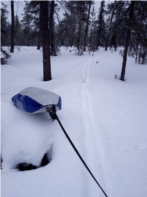
Как волокуша туда забралась?

Однако похоже, что повторяется вчерашний сценарий! На выходе из Нелкозера встречаю свежий снегоходный след, уверенно ведущий вдоль реки. Увы, через километр след так же уверенно поворачивает в обратный путь по густому лесу.. Рассказав белкам все, что я думаю по этому поводу, иду сквозь лес по азимуту, постепенно подтягиваясь к редколесью, по которому еще дома нарисовал свой трек.