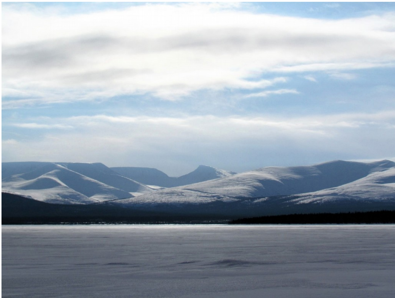
Слева проплывают Хибины.