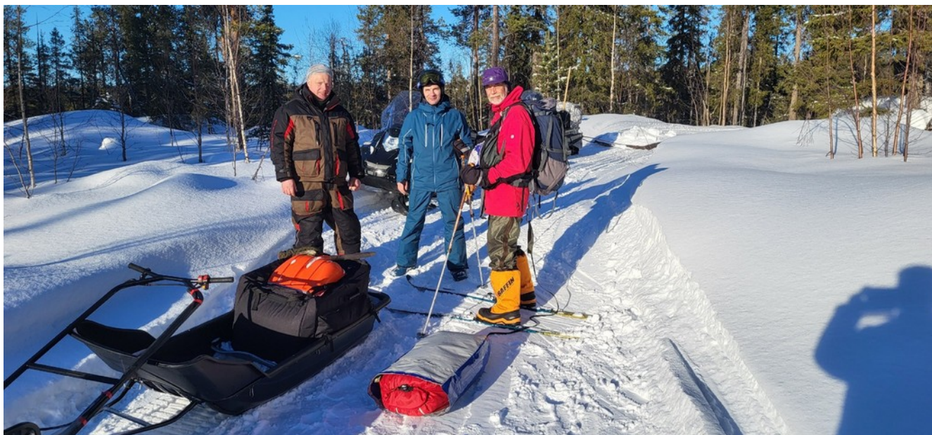
Ребята из Полярных Зорь готовят трассу для лыжного марафона.

Иду по бесконечным перелескам. Дорога одна, укатана неплохо, да и снег здесь совсем другой - лыжи скользят, как им и положено. О планах на сегодня стараюсь не думать, пусть все идет как идет, вечером решим. Мысленно представляю, как ползет по карте указатель, показывая всем моим болельщикам, как хорошо я продвигаюсь сегодня. Лишь на следующий день после финиша я узнаю, что никакой указатель никуда не ползет, потому что в этот особенный день 17 марта сервера провайдера, где размещен сервис GeoLoc, уже снесены мощной хакерской атакой. Так вот получилось, что все мои подвиги финишного дня и ночи оказались в итоге скрыты от наблюдения.