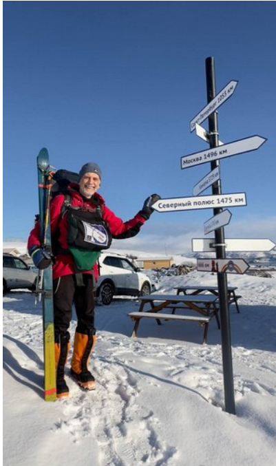
На старте 9 марта.