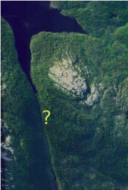
Что там? Проходимо ли?