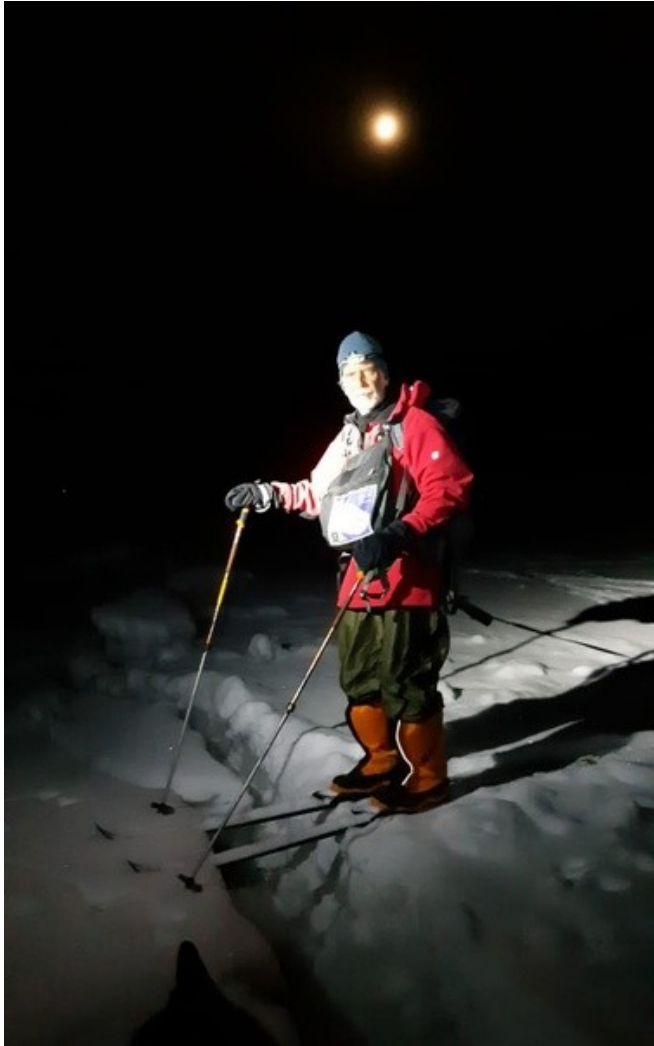
Финиш на Белом море.

Часа на два меня хватило не думать о времени, километрах и прочем. Потом я увлекся узнаванием поворотов и спусков дороги, откуда-то пришел азарт и я неожиданно для себя побежал! Ну да, самое умное дело, на дистанции в 300 с лишним километров ускоряться за 10 километров до финиша! Хорошо, ночью никто не видел моей техники классического лыжного хода с рюкзаком и волокушей на буксире! Удивляясь самому себе, понимаю - своим бегом я вовсе не пытаюсь как-то улучшить результат. Ну какая в конце концов разница, парой минут или парой часов больше или меньше?