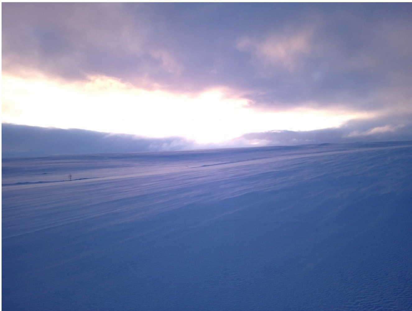
Утром 11 марта. Просто тундра.

Вчерашняя погодная мерзость сменилась кристально чистым западным ветром. Подморозило, снег уже перемело за ночь и уложило надувами. Жадно ловлю просветы солнца, которое пробивается сквозь облачную муть.