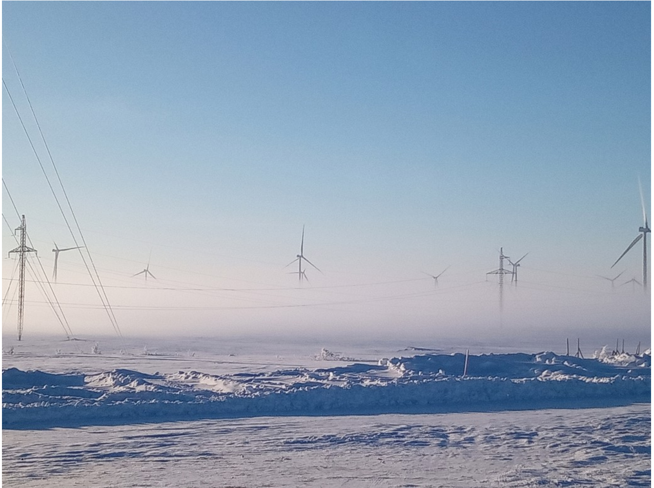
Кольская ВЭС.

К северу от них, где сейчас я, тундра сильно холмистая, с озерами и лабиринтом березового криволесья. К югу, куда лежит мой путь - тоже тундра, но другая, глаже и белее. Между этими двумя тундрами ниточка асфальта. Это и есть граница, мой персональный Рубикон. Пока не перешел его - я вроде как и не вырвался из уже пройденного в феврале, не ушел в открытую тундру как в открытое море..