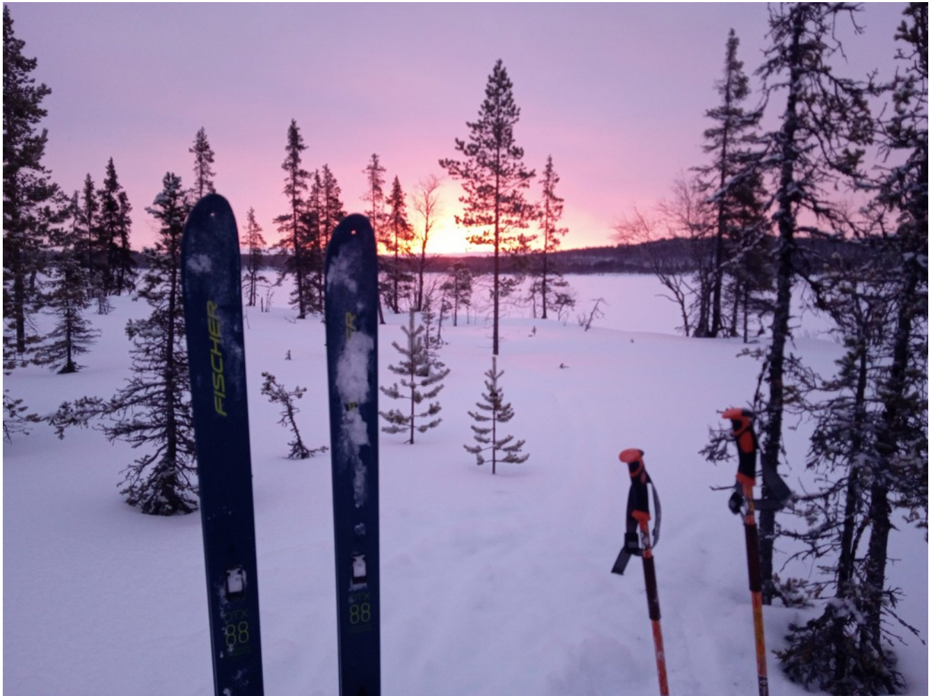
Рассвет над Ловозерскими тундрами. Нелкозеро.

Немного поспать все же удалось, но к 5 часам утра решил, что дрожать дальше нет смысла, лучше уж шевелиться. В награду получил волшебные краски рассвета над далекими Ловозерскими тундрами.