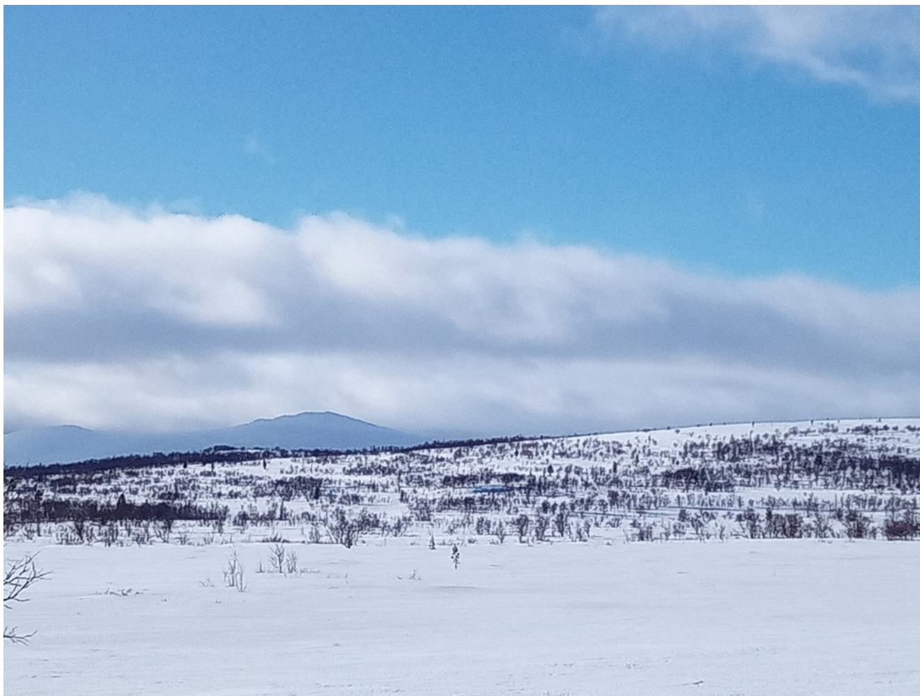
На горизонте - Вируайвенч! Там заканчивается «открытая тундра».

Обычно я избегаю березового криволесья, в нем слабее ветер, а значит - и наст не такой крепкий. Но тут все с ног на голову! Лезу в березки. И — чудо! Иду более-менее нормально! Что здесь творилось? Не найдя ответ, подкрадываюсь окольными путями к безлесному увалу. На нем все как положено, снег надежно держит лыжи, выдыхаю... И. вот они, встали на горизонте — горы Кицких тундр!